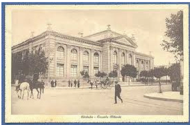
Foto 2. Escuela Alberdi

Pero su labor sufrió otro traspie al ser separada de sus cargos, lo que la decide trasladarse a la Capital Federal. Tiempo después recordó esa instancia de la siguiente manera: “La lucha ha sido ardua, el camino difícil. A cada paso un obstáculo que debía sortear sin dejar aquel sagrado deber de fe, de esperanzas, de consagración, de dignidad para poder llevar con honor el nombre de riojana” 16 .