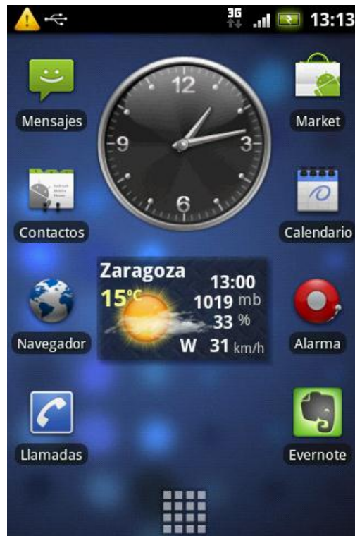
Gráfico 3: Widgets