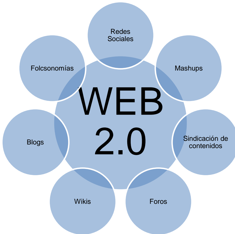
Gráfico 1: Definición grafica del término Web 2.0

Tal como se desprende de las líneas anteriores, el desarrollo de una Web 2.0 supone un cambio radical hacia una nueva etapa, abriendo a los usuarios de las nuevas tecnologías un amplio abanico de posibilidades hacia el saber. El siguiente gráfico ( Gráfico 1 ) muestra alguna de múltiples herramientas que integran la Web 2.0.