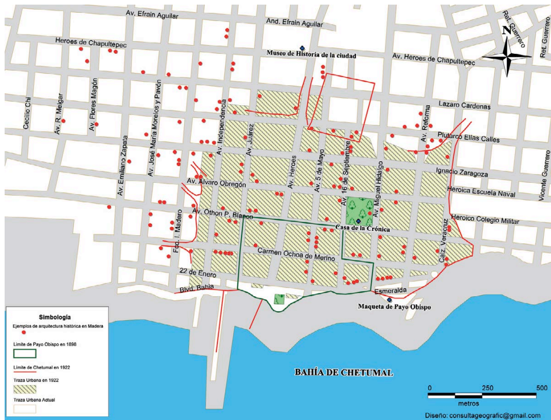
Figura 9. Mapeo de la casas con arquitectura de madera existentes en Chetumal a noviembre de 2006 (En azul situamos el Museo de historia de la ciudad, la Casa de la Crónica y la Maqueta de Payo Obispo, en rojo, disponemos las casas de madera existentes).