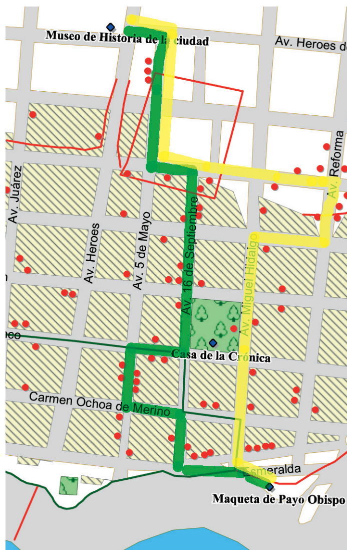
Figura 10. Posibles itinerarios urbanos para la difusión de las casas de madera de Chetumal. En rojo aparecen marcadas las viviendas históricas en madera.