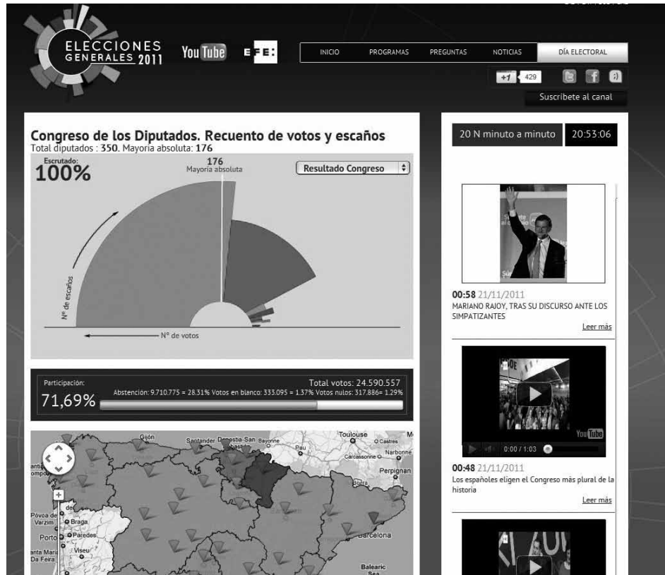
Figura 1 Imagen del especial electoral de YouTube