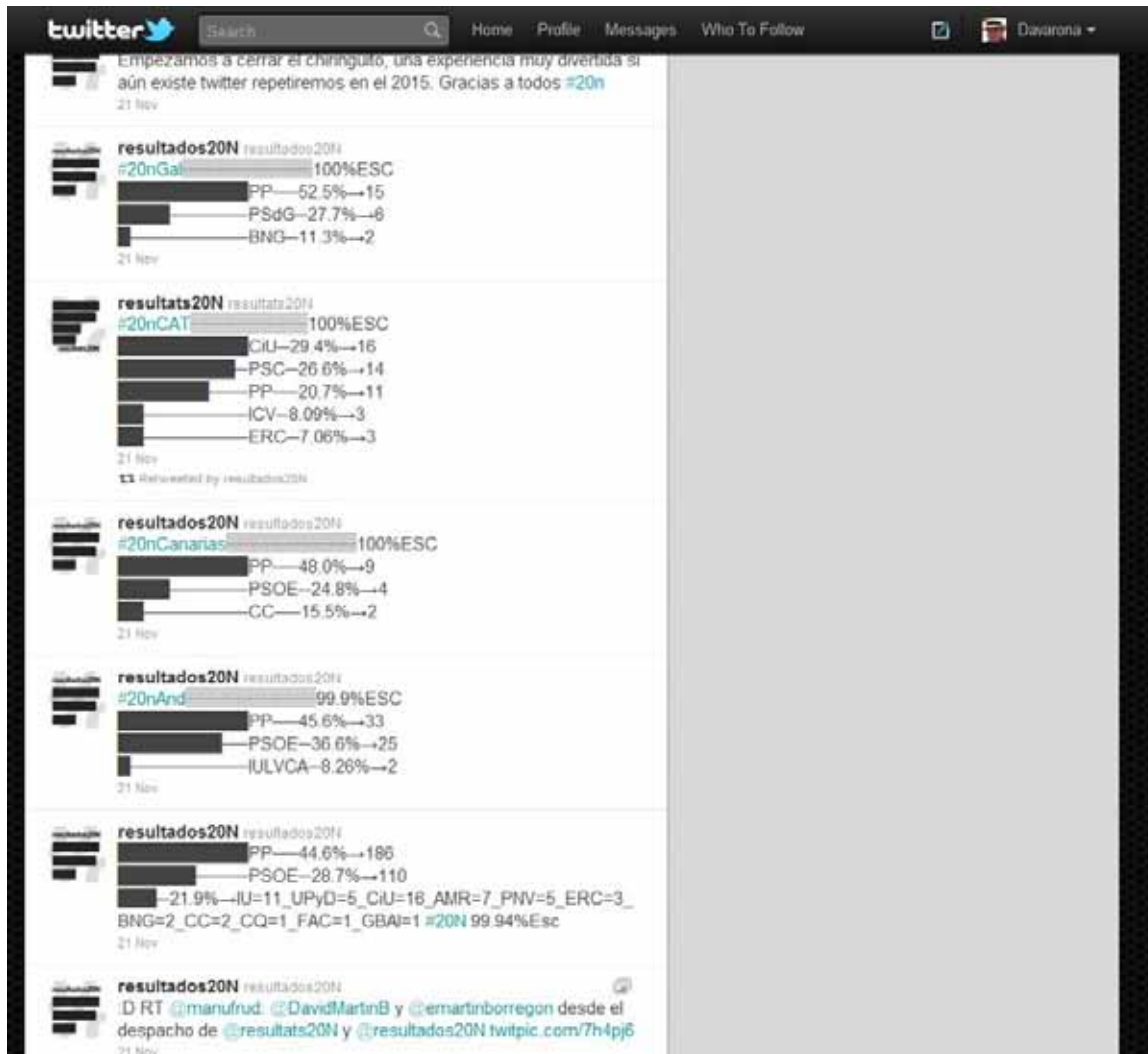
Figura 4 Imagen de la cuenta de Twitter @resultados20N