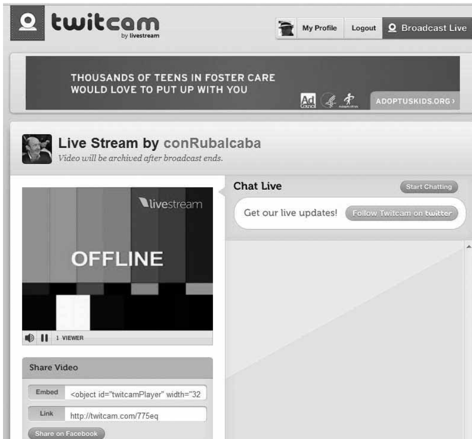
Figura 3 Imagen de la ‘Twitcam’ protagonizada por Rubalcaba

información que se producía en las redes sociales, los cibermedios tenían que hacer lo mismo que un usuario particular.