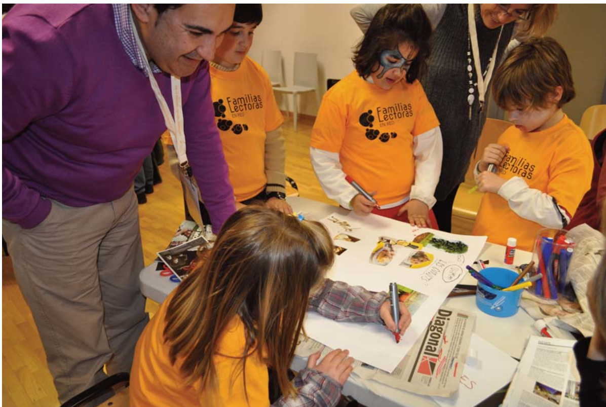
TALLER Niños de todas las edades se expresan de formas diferentes