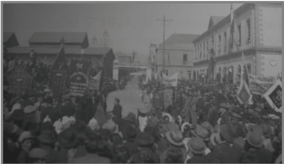
Fotografía n.º 1. Masiva recepción del Presidente Pedro Aguirre Cerda a la ciudad-puerto de Coquimbo en 1940. 19

“Están en pleno desarrollo los planes de pavimentación de la ciudad, los que siguen extendiéndose hacia los barrios altos, con un verdadero abandono del sector norte de la población que, junto con merecer igual consideración que parte de las autoridades por su semejante condición de contribuyentes, necesitan de salidas pavimentadas a fin de facilitar el tránsito que se ha intensificado enormemente desde la iniciación de los trabajos y producción de Juan Soldado [...] Ojalá que la Autoridad Comunal entrara a considerar debidamente estas circunstancias para dar preferencia, en un próximo plan de pavimentación, a la de las calles del sector indicado de la ciudad, en donde encontraría la mejor cooperación de los propietarios y habitantes.” 18