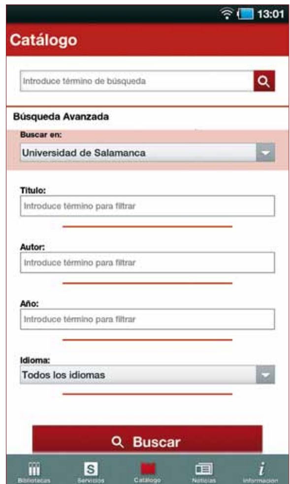
Aplicación para Android.

El software utilizado para el desarrollo de la aplicación fue diferente para cada plataforma o sistema operativo. En ambos casos se han empleado SDKs (Software Development Kits), como herramientas que ofrecen las plataformas para poder programar aplicaciones para sus sistemas operativos. Los kits de desarrollo de software utilizados para la programación de las aplicaciones Biblio USAL son facilitados por las propias plataformas de Android y de iOS,