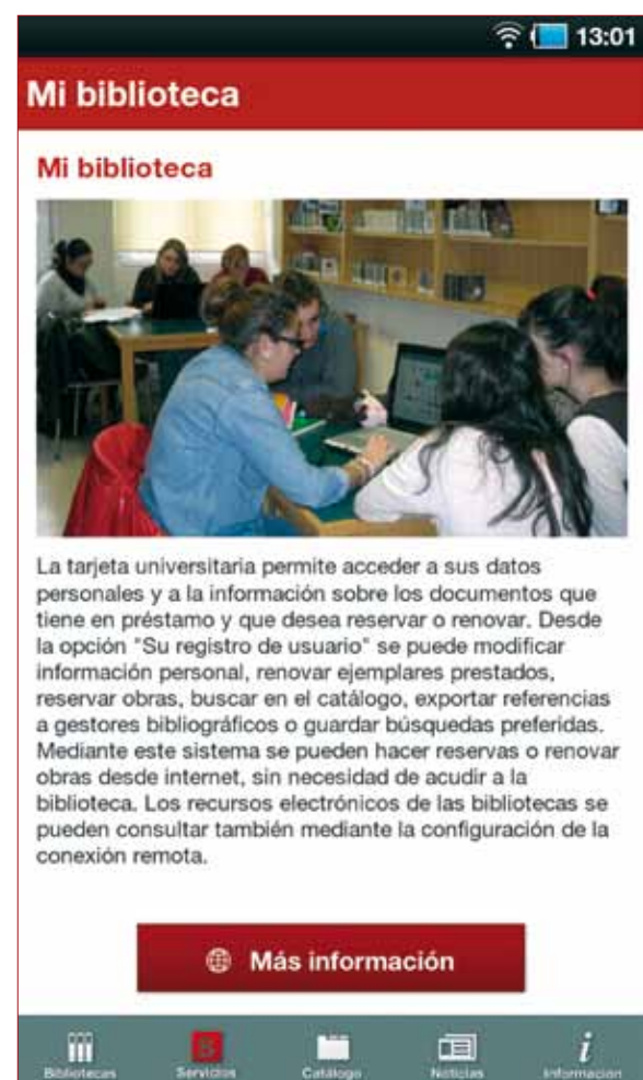
Aplicación para Android.

servicio o utilidad que se esté consultando. La información facilitada en esta sección es la dedicada a búsqueda de documentos, Mi biblioteca o acceso personalizado, préstamo de documentos, espacios y equipos, servicios de referencia, recursos electrónicos, conexión remota, acceso a documentos externos, formación en información, apoyo a la investigación, servicios de información, gestores bibliográficos y acceso abierto. El diseño de esta sección, la más textual de los cuatro grandes bloques, se ha realizado de forma que, según el dispositivo con que sea consultada, se adapte a la pantalla tanto la fotografía de presentación como el texto introductorio, de manera que sea sencillo leer el contenido explicativo sin necesidad de emplear demasiadas opciones para mover el texto en la pantalla.