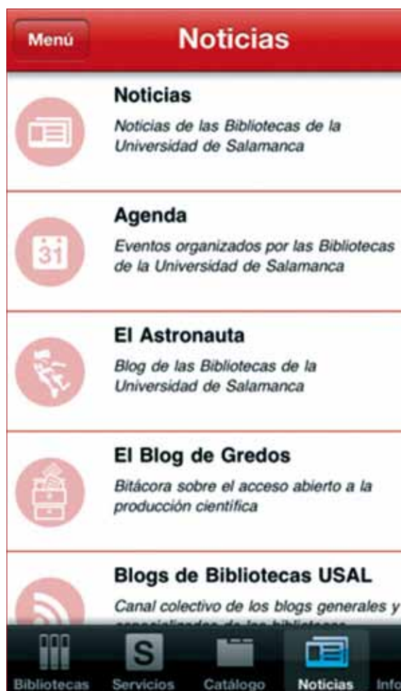
Aplicación para iPhone.

a la información que un usuario necesite de forma inmediata, así como para poder aprovechar las posibilidades de los dispositivos, tanto de geolocalización, de envío de contenidos o mensajes, como, por supuesto, de realizar llamadas telefónicas. Este es un claro ejemplo de la diferencia entre web y aplicación móvil, en la web se ofrece un teléfono, mientras que en la aplicación móvil, se ofrece el número y se permite llamar directamente. Otro ejemplo similar: en la web se ofrece un mapa de ubicación, con la aplicación el mismo dispositivo sirve de guía para llegar a la biblioteca.