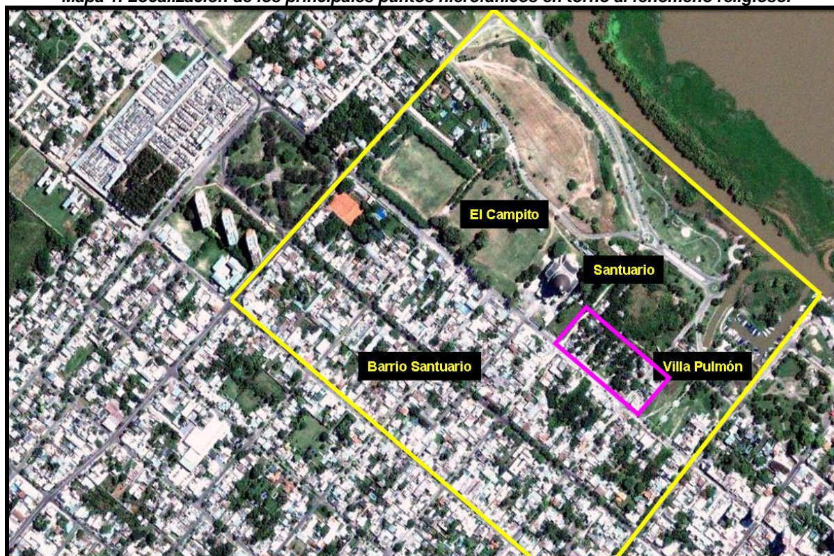
Mapa 1. Localización de los principales puntos hierofánicos en torno al fenómeno religioso.

Pero las transformaciones urbanas no alteraron toda la ciudad, sino que se concentraron en un sector específico, cuyo eje articulador es el predio llamado “El Campito”, como podemos ver en el mapa N° 1. Esto incluye el Barrio Santuario, Barrio 14 de Abril, parte del área central (núcleo histórico) y Barrio Prado Español.