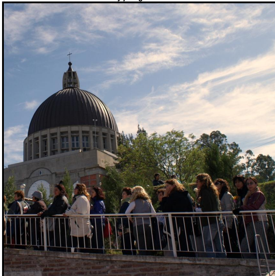
Foto 3: Prácticas turísticas y peregrinas en torno al Barrio Santuario