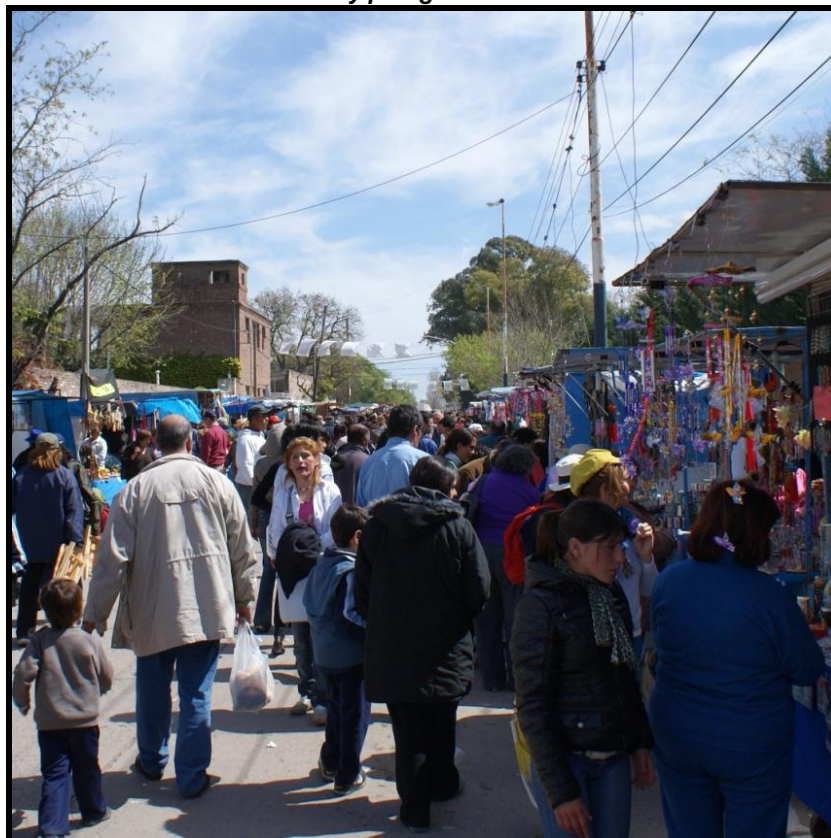
Foto 3: Prácticas turísticas y peregrinas en torno al Barrio Santuario