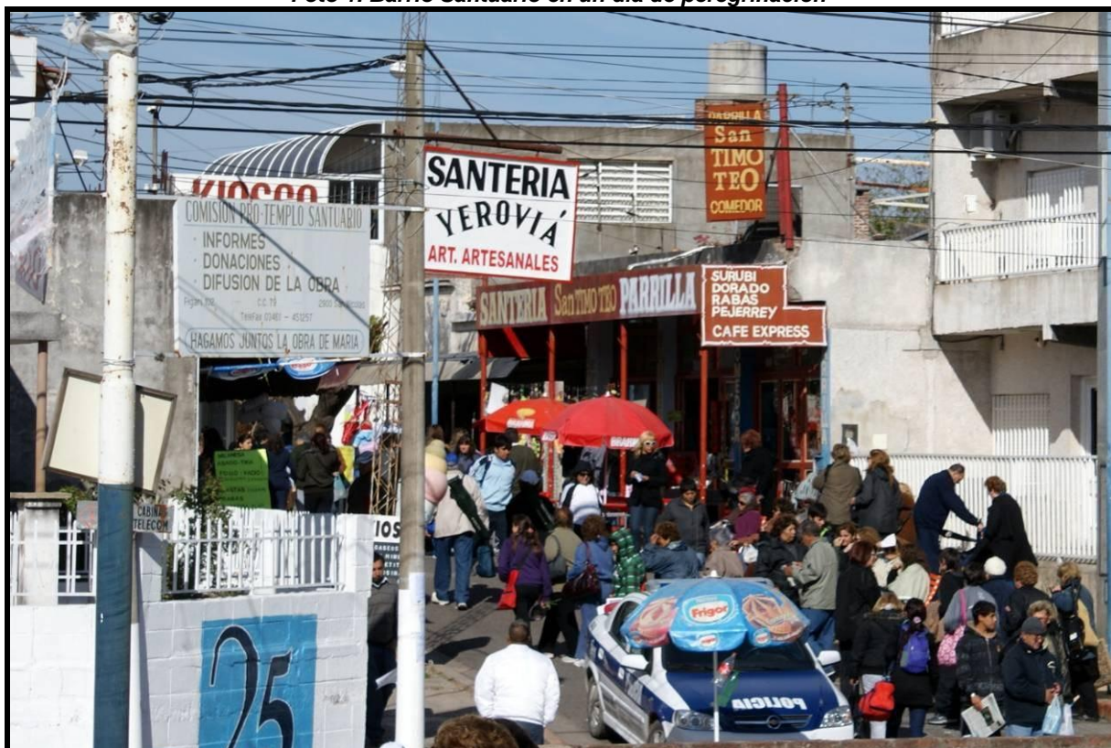
Foto 1. Barrio Santuario en un día de peregrinación

Fuente: fotografía propia tomada el 25 de septiembre de 2010