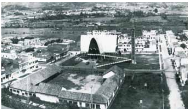
Imagen 1. Construcción escolar en 1940.

Adicional a lo anterior, cada escuela debía de aparecer como la extensión de la Iglesia católica. Y, efectivamente, las escuelas en Antioquia habían sido creadas bajo el amparo y administración de las iglesias católicas; no en vano muchas de las escuelas que hoy existen en Antioquia están ubicadas inmediatamente al lado, en la misma construcción física, o en el contexto cercano a una iglesia católica.