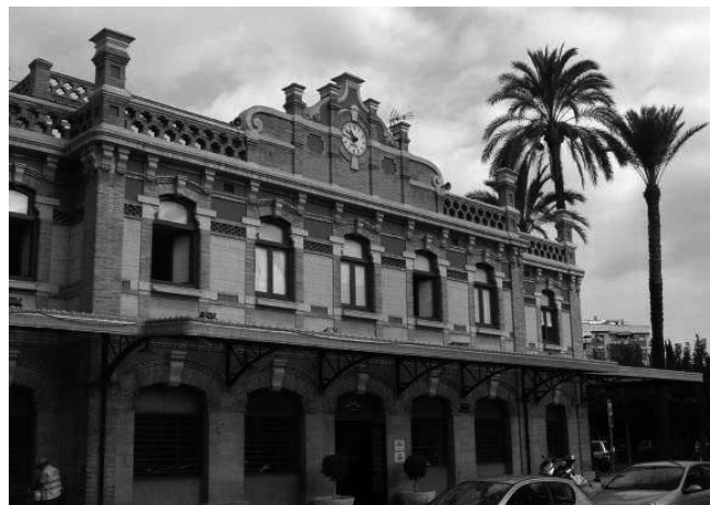
Estación de ferrocarril de Murcia-Zaraiche (1930)

Resultaría excesivamente prolijo hacer un detenido inventario de cada uno de estos elementos o de reproducir el aparato estadístico de los mismos, que se encuentra en las obras referenciadas, por lo que nos limitaremos a hacer un breve recuento de aquellos bloques temáticos significativos que constituyen hoy en día el legado histórico ferroviario.