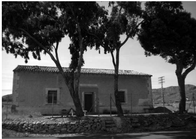
Casilla de peones camineros de la carretera de tercer orden de Cartagena a Mazarrón.

do viario, y sólo obras concretas y simbólicas merezcan al menos la identificación como un elemento relevante del patrimonio histórico de la obra pública en Murcia. En este sentido es habitual encontrar a nivel local o autonómico la protección de varias decenas de puentes que formaron parte de esa primera hornada de construcciones realizadas durante la segunda mitad del siglo XIX y las primeras décadas del siglo XX 43 .