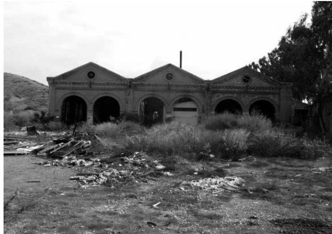
Antiguos talleres ferroviarios de la estación de Águilas.

Otro caso relevante y lógico de destacar es el de los legados conjuntos de la minería y el ferrocarril, habituales en todo el sureste español. Los numerosos restos de instalaciones de la sierra de Cartagena u otros puntos aislados son buena muestra de ello. Especial relevancia, por su interés tecnológico y por su estado de conservación, habría que atribuir al conjunto del embarcadero de El Hornillo en Águilas, construido por la compañía británica explotadora del ferrocarril para facilitar el embarque de minerales de hierro que llegaba al puerto de Águilas por ferrocarril. En realidad, se trataba de dos instalaciones anexas destinadas a las operaciones de almacenamiento, clasificación y embarque de los minerales. El embarcadero propiamente dicho