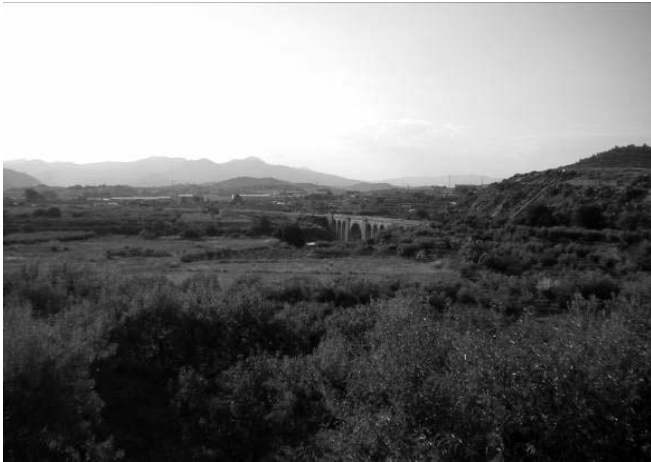
Vestigios del paisaje histórico ferroviario en la Región de Murcia: vía verde del Noroeste, en Cehegín.

También forma parte del legado arquitectónico ferroviario el grupo o conjunto de instalaciones que se solían situar alrededor de las zonas de explotación ferroviaria. Estos espacios eran muy abundantes y se localizaban junto a talleres y depósitos de locomotoras, en torno a nudos de ferrocarril o junto a las grandes estaciones urbanas. El deterioro de estos espacios fue muy importante, sobre todo cuando el ciclo ferroviario cambió y se produjo un progresivo abandono de estas instalaciones, además de registrarse también un avance de la urbanización. Son muchos los casos y ejemplos que todavía hoy en día perviven en la región murciana y se hace necesaria la realización de un inventario específico de los espacios y elementos ferroviarios que contribuya a valorar su conservación y actuaciones a realizar. Los poblados ferroviarios son un buen ejemplo del tipo de relaciones económicas y sociales que se desarrollaron en estos espacios, y del conjunto de instalaciones que se concentraron en los mismos. En Murcia se identificó el caso de la aldea ferroviaria de Calasparra, en la línea de Chinchilla a Cartagena, hoy prácticamente deshabitada pero que llegó a contar con cerca de 300 habitantes en la década de 1960 37 .