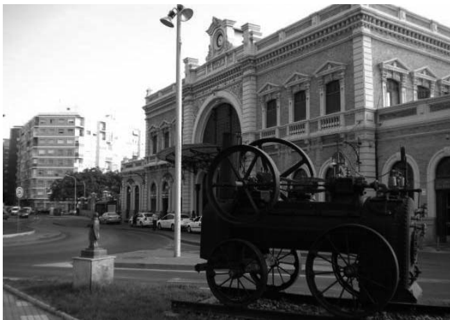
Estación de ferrocarril de Cartagena (1907) y Murcia-Zaraiche (1930)