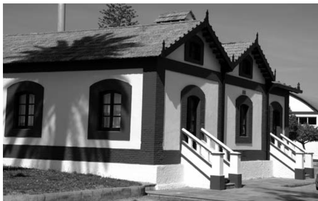
11.- Comedor de ingenieros. Julio 2010

Destacaremos de entre todas las edificaciones conservadas el propio dique de Matagorda, pieza fundamental en la historia de la Factoría y verdadero eje articulador de su actividad fabril a lo largo de sus cien años de vida operativa. Los talleres, andenes, muelles y zonas de servicios, incluido el viejo recinto de la Trasatlántica, completan la nómina de una veintena de edificios levantados casi todos durante el último tercio del siglo XIX.