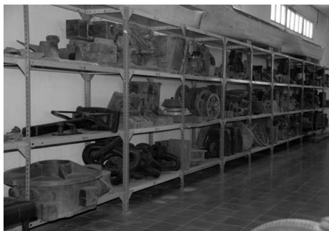
11.- Almacenes del Museo el Dique. Fondo de herramientas

El Fondo de piezas está constituido, a fecha de hoy, por un total de 3275 elementos, en su mayoría herramientas, que recorren todo el espectro gremial que orbitaba en torno a la construcción naval. El conjunto de herramientas y máquinas se distribuye en tres grandes espacios: un almacén cubierto donde se clasifican por profesiones las piezas no expuestas en las salas del Museo; un almacén a la intemperie que agrupa un centenar largo de grandes máquinas que en su momento formaron parte de la actividad productiva del astillero y que hoy, convenientemente tratadas, se han situado en el área Este de nuestro almacén principal; y las piezas expuestas al público tanto en las diferentes salas del museo como en algunas zonas concretas del recinto exterior del dique (Parque de anclas, aparcamientos de la zona histórica, jardines de estribor del dique de carenas y muelles nº 1 y nº 2 de Matagorda).