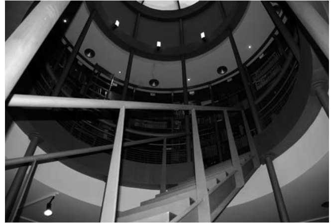
13.- Sala de Investigadores. Hemeroteca

La actual biblioteca de Matagorda fusiona dos fondos de libros de diferente origen, procedente uno de la biblioteca de la propia Factoría y el otro del denominado depósito de San Juan de la Salle (que acumulaba libros provenientes de la sede central de la Empresa Nacional Bazán en Madrid). Aunque se trata de un conjunto de obras que dadas sus características no podemos considerar de especial valor, sí encontramos algunas colecciones que por específicas merecen ser destacadas. Es el caso de la serie completa del registro de buques elaborado por la sociedad de clasificación “Lloyd’s Register of Shipping” que se remonta a fines del siglo XVIII, las colecciones de obras relacionadas con maquinaria en general de finales del siglo XIX o los manuales de arquitectura y habilitación naval de principios del XX.