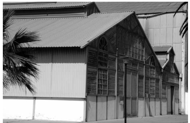
5.- Fachada principal del antiguo Taller de Maquinaria

Toda esta área se completa con dos muelles de reparaciones de 150 metros que disponen de todos los elementos de maniobra para el atraque y reparación de los buques, y entre los que destacaremos una grúa marca Zorroza de 1942, en el muelle número 1, y dos grúas (una tipo Cigüeña de 1920 y otra tipo Macosa de 1960) el muelle número 2.