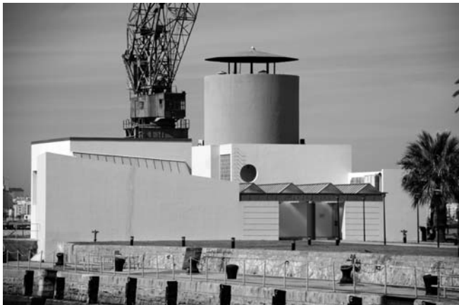
8.- Museo “El Dique”, fachada principal. Julio 2008

El Museo, ubicado, como ya se ha dicho, en el antiguo edificio de la cámara de bombas del Dique de Matagorda, es un complejo espacio de varios niveles cuya habilitación combinó el respeto a la traza del antiguo edificio (cámara de bombas, antigua sala de calderas y muros de la primera planta) con la erección de nuevos cuerpos que, añadidos a las zonas rehabilitadas, dotaban al edificio de suficiente espacio, tanto para la exposición de piezas recuperadas como para la incorporación de los servicios auxiliares de biblioteca y sala de consultas.