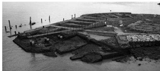
7.- Vista parcial del Fuerte de Matagorda

La zona del castillo, es un área que estuvo ocupada por el antiguo fuerte de Matagorda, fortificación de la que solo queda constancia en los textos. Las actuales ruinas que presenta la península de Matagorda parecen datar de un intento de refortificación de esta zona, llevado a cabo por el Ramo de Guerra en los últimos años del siglo XIX.