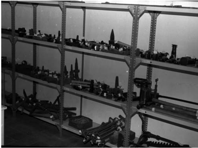
3.-Herramientas manuales depositadas para su catalogación en los almacenes del Museo “El Dique”. Julio 1992

líneas apretadas de los diferentes inventarios que se elaboraron en los primeros años de trabajo... hoy con la labor aún a medias, pero bien ordenada, y la ilusión puesta en el aumento de los fondos disponibles y la mejora nuestras instalaciones, el que hemos dado en denominar Museo “El Dique” ofrece al visitante una magnífica exposición permanente en las instalaciones visitables y un inmenso patrimonio etnográfico y documental que, a pesar del esfuerzo, aún no ha podido ser inventariado en su totalidad.