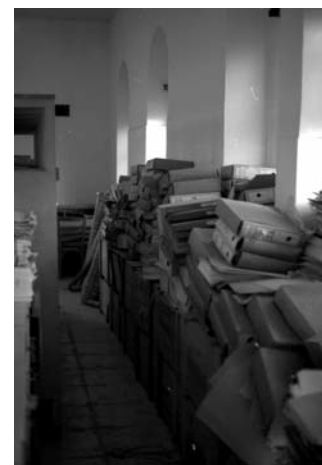
2.- Documentación apilada en el viejo edificio del Botiquín de Matagorda. Marzo 1991

Sin embargo, a pesar del lamentable estado que presentaban algunos de los elementos guardados en el recinto de Matagorda, lo cierto es que se había conservado material suficiente como para mostrar la historia de nuestra industria naval y configurar uno de los mejores archivos empresariales del país.