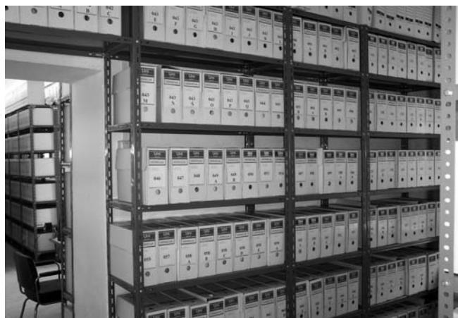
12.- Archivo Histórico. Vista parcial.

El fondo documental lo configuran dos grandes archivos y dos depósitos externos. Los dos archivos almacenan la mayor parte de la masa documental generada por los astilleros de Puerto Real y que hoy no está operativa. El prime-