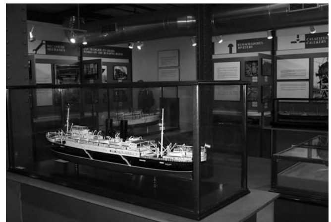
10.- Museo “El Dique”. Sala III

La Sala III, situada en la primitiva cámara de calderas, describe de forma lineal el proceso de construcción de un barco de acero. Está dividida en tres áreas que pretenden explicar las distintas tareas que realizaban los operarios del astillero durante la etapa constructiva: trabajo en talleres, trabajo en grada y trabajo en la dársena, destacándose especialmente aquellas faenas y gremios que hoy forman parte de nuestro pasado industrial (forja y fundición, remachado, calafates, herreros de ribera...)