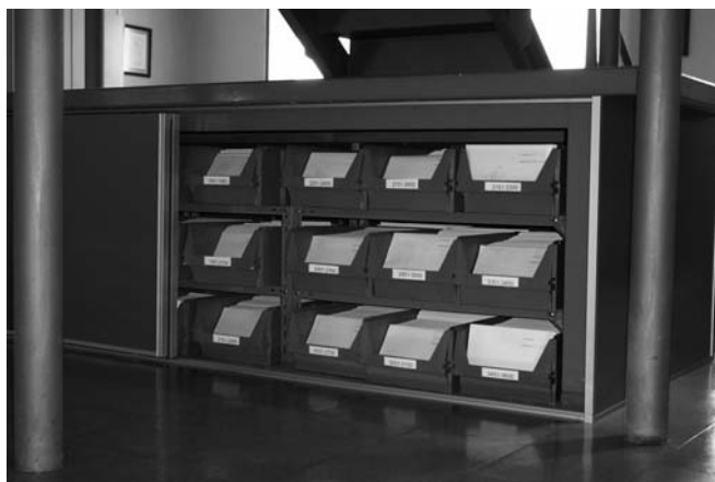
10.-Sala de Investigadores: fondo de imágenes ( placas fotográficas de vidrio)

imagen móvil o archivo filmográfico y videográfico. A su vez, cada uno de estos grandes archivos consta de una serie de repertorios documentales que dan cuerpo y hacen visible el pasado de nuestro astillero y nuestra empresa.