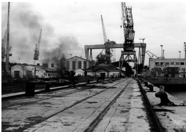
1.- Talleres de la antigua factoría de Matagorda antes de su rehabilitación. 1990

En diciembre de 1989, hace ya más de 20 años, la entonces Compañía Astilleros Españoles iniciaba un proyecto que, sin lugar a dudas, en esos años pasaba, cuanto menos, por insólito. Se trataba de ordenar, cuantificar y valorar el patrimonio acumulado durante más de cien años por el clausurado astillero de Matagorda, y que en aquellas fechas permanecía depositado en las obsoletas y abandonadas instalaciones de la vieja Factoría.