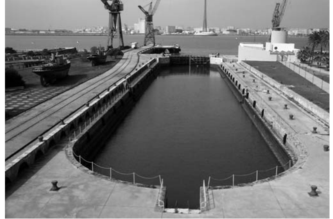
4.-Dique de Matagorda Julio 2010

La zona de dique, antedique y muelles es un espacio de aproximadamente 18.000 m 2 , ocupado por el dique de carenas de la empresa de A. López y Cía., los antediques o andenes que lo rodean y dos muelles de reparaciones.