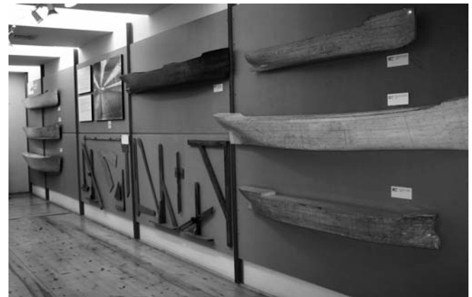
9.- Museo “El Dique”. Sala II

Situada en el piso alto de la antigua cámara de calderas, la Sala II centra su objetivo en la descripción de los procesos de diseño y trazado de un barco. Una colección de semimodelos para trazado y diferentes herramientas de este gremio casi desaparecido, son las piezas más llamativas de la sala.