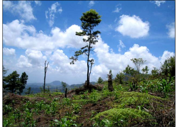
Imagen # 1. Efecto de la presencia del ser humano en el área núcleo de la Reserva Montecillos, Honduras.

Hoy en día, aún se plantean óbices para el establecimiento eficaz de las áreas protegidas. Gran parte del problema reside en el desconocimiento de las funciones de éstas y los diversos beneficios que proporcionan a la sociedad, ya sea directa o indirectamente (UICN/ BID, 1993). Esta situación se evidencia al corroborarse que la mayoría de los gobiernos de América Latina y el Caribe, no pueden conservar sus áreas protegidas y su biodiversidad (Ibid, 1993). Sin embargo, las ONG's han fungido como alternativa positiva y garante de un éxito seguro en su manejo. La Fundación Ecosistema Montaña de Comayagua (ECOSIMCO) en Comayagua, Honduras, es un ejemplo del área centroamericana en la jurisdicción del Parque Nacional Montaña de Comayagua (PANACOMA).