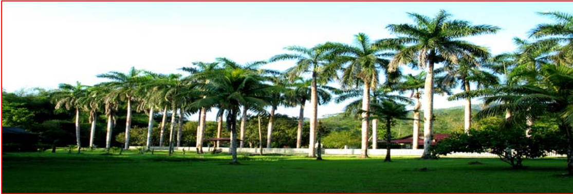
Imagen # 3. Vista parcial del Jardín Botánico Lancetilla, Honduras.

En esta área se promueve el ecoturismo, se realizan estudios de plantaciones forestales y con un alto grado de responsabilidad socio-ambiental, se integra a la comunidad residente para promover el manejo sostenible de los recursos. Esto último se logra permitiendo la diversidad de producción tanto en terrenos de la reserva como de las propiedades aledañas a ésta. Así por ejemplo, en completa coordinación con la comunidad, la dirección administrativa de la reserva, fomenta el cultivo y la exportación de productos como Garcinia mangostana , entre otros. Este ejemplo evidencia que la industria nacional del turismo puede coordinar con las comunidades locales para crear una red de empleo para profesionales en turismo y para generar empleos de otra índole (Haysmith y Harvey, s/f).