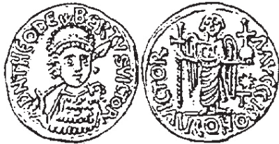
Figura núm. 1: Teodeberto de Australia