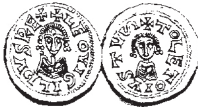
Figura núm. 4: Leovigildo doble busto