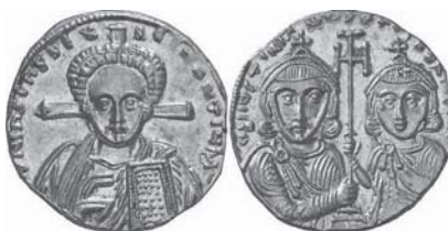
Figura núm. 15: Justiniano II y su hijo