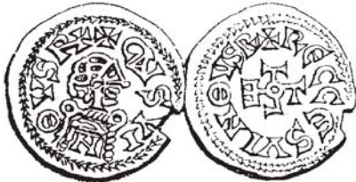
Figura núm. 7: Chindasvinto y Recesvinto