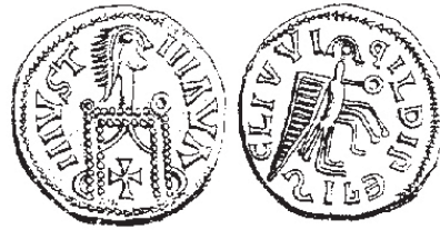
Figura núm. 2: Justiniano-Leovigildo