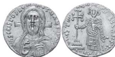
Figura núm. 12: Busto de Cristo (Justiniano II)