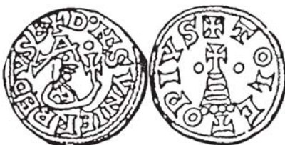
Figura núm. 13: Suniefredo