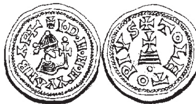
Figura núm. 10: Wamba con cetro