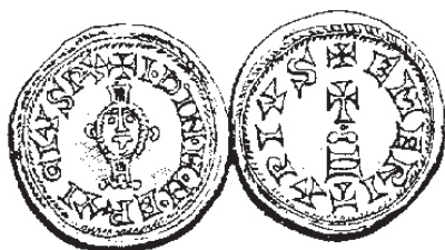
Figura núm. 11: Busto de Cristo (Ervigio)