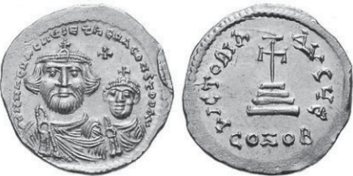
Figura núm. 5: Heraclio y Heraclio