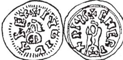
Constantino Figura núm. 6: Iudila