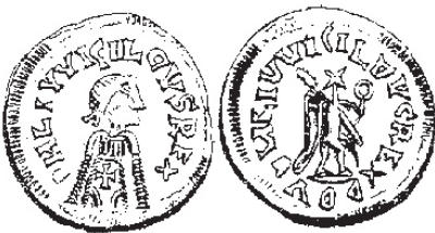
Figura núm. 3: DN Leovigildo Rex