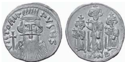
Figura núm. 9: Constante II y sus hijos