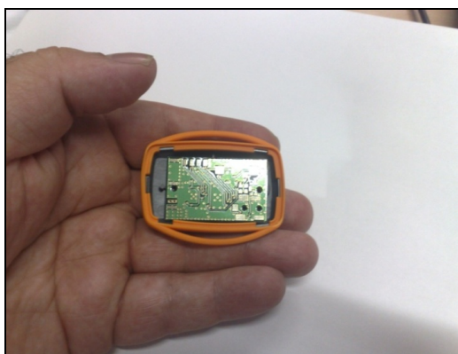
Figura 3. Acelerómetro triaxial con comunicaciones

El instrumento necesario para registrar el vector aceleración en cualquier dirección y sentido espacial es el acelerómetro triaxial de salida lineal. Este elemento puede ser encapsulado en un elemento pequeño y no intrusivo, como se puede ver en la Figura 3, lo que representa un peso despreciable que no obstaculiza ni limita prácticamente ningún tipo de actividad física. Como se ha comentado previamente, el acelerómetro registra valores de aceleración a una frecuencia de muestreo fija. A partir de los valores medidos se puede establecer durante qué periodo de tiempo el usuario ha estado en desplazamiento y durante cuál ha permanecido estático. Además, mediante la aceleración podemos detectar el nivel de intensidad del movimiento y a partir del número de pasos podemos obtener el gasto energético.