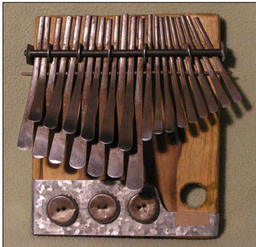
Fig. 1. «Shona Mbira dza Vadzimu»

go, la zona de interacción cultural definida por el «mbira» se limita a la etnia Bantú y sus territorios colindantes de la República Centroafricana y la región Igbo de Nigeria en el continente africano. La presencia de este instrumento en las diferentes partes del mundo no puede considerarse permanente y en la mayoría de los casos no forma parte integral de las actividades culturales habituales de las áreas culturales donde se ubica. Encontramos numerosos ejemplos en África y en otros territorios con diferentes elementos culturales, pero la zona de interacción cultural definida por cada uno de ellos tiene en cuenta una serie de factores y de fenómenos que van más allá de la mera presencia en dichos territorios de esos elementos culturales. Aunque el mundo se ha estrechado con la evolución de la tecnología, la explicación de la diseminación de cualquier elemento cultural se explica mejor desde un punto de vista difusionista que desde uno evolucionista. Los materiales culturales de África se encuentran fácilmente en Asia, América y Europa, donde se han difundido, entre otras vías, a través de los turistas y de los aficionados.