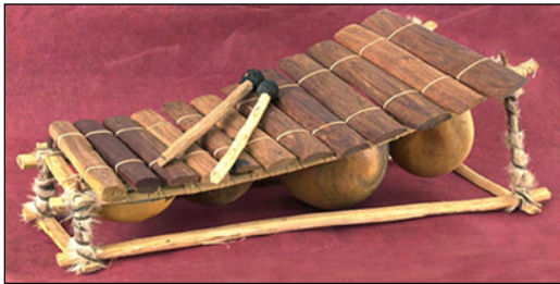
Fig. 3: Xilófono

étnico de los Chopi lo denomina «timbila»; tiene diferentes tamaños y los agrupan en una orquesta que también se llama «timbila». Durante un período significativo de tiempo, los estudiosos no alcanzaron un completo acuerdo sobre el origen o la cuna del xilófono. Mientras que la mayoría de expertos del campo de la antropología y del de la etnomusicología insistían en que el xilófono era nativo de África, otros defendían que este instrumento había venido de Indonesia junto con la enfermedad denominada elefantiasis, con la que se asociaba, y que había entrado a África por Mozambique (Jones, 1964). Sin embargo, la etnia Chope de Mozambique creía por su parte que los espíritus se lo dieron a sus padres fundadores; ¿podrían ser estos espíritus los indonesios que vinieron y volvieron por el agua? Aunque esto permanecerá por ahora sin respuesta, ya que no es relevante para este trabajo.