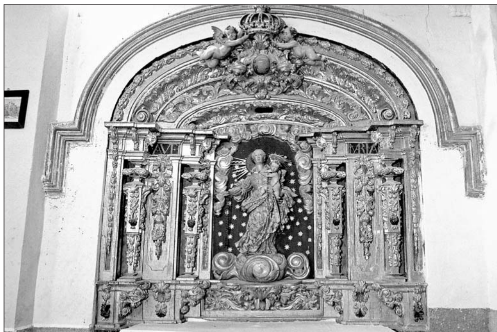
Retablo de la Virgen del Rosario. Parroquia de Latre.

El repertorio iconográfico está monopolizado por la imagen de Nuestra Señora del Rosario. Esta, de pie, sostiene al Niño en su costado izquierdo, que imprime a sus piernas de rellenas carnes cierto movimiento. La Virgen, rodeada de aureola de nubes y cabezas de angelotes alados, viste túnica y manto. De su mano derecha pende el rosario. El bulto escultórico —que está dispuesto en contraposto— presenta un ovalado rostro de escasa belleza formal y evidente seriedad, silueteado por un cabello con raya en medio y recogido hacia atrás. Su mirada es levemente alta. Abundantes pliegues recorren su manto, el cual describe una amplia curva a la altura de su cadera derecha.