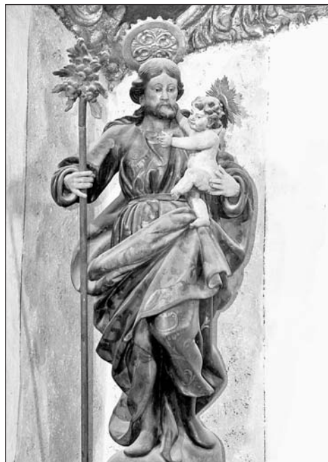
San José. Parroquial de Javierregay.

La policromía permite la diferenciación de las distintas partes de la vestimenta. Un azul claro se reserva para el fondo de la túnica, presentando motivos florales pintados en rojo y azul oscuro. Una tonalidad verdosa se destina a la sobretúnica, con plásticos galones, y un color rojo recubre el volado manto. Las dos últimas prendas se embellecen con dorados motivos vegetales. Las encarnaciones son anaranjadas.