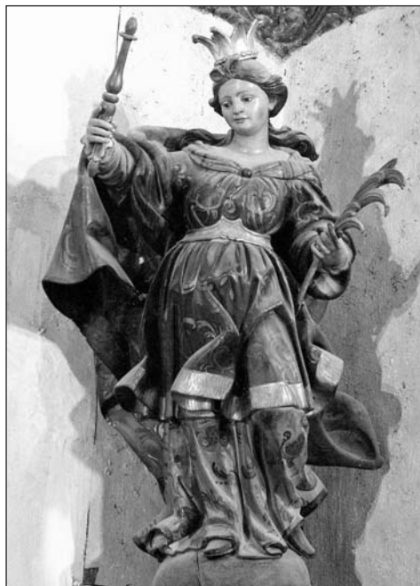
Santa Orosia. Parroquial de Javierregay.