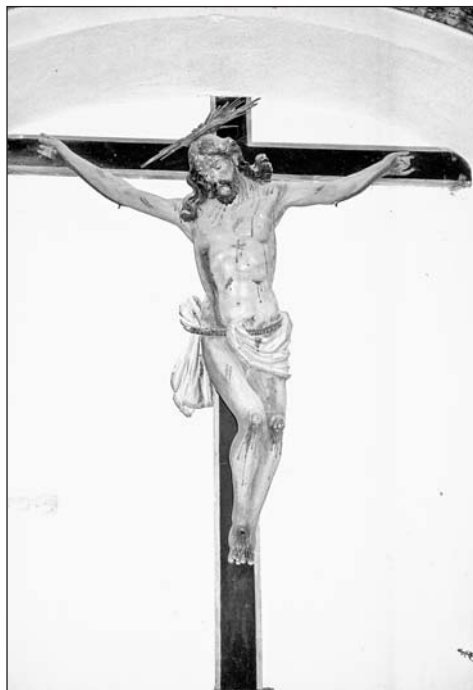
Santo Cristo. Parroquial de Latre.