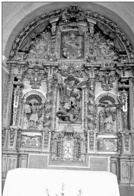
Retablo mayor de san Miguel Arcángel. Parroquial de Latre.

se en un acto de sublimación espiritual. Finalmente, expresar que la tradicional corona de espinas ha sido aquí sustituida por otra de haces de rayos, de elegante diseño, que se emplaza no en la frente sino en la parte superior de su cabeza.