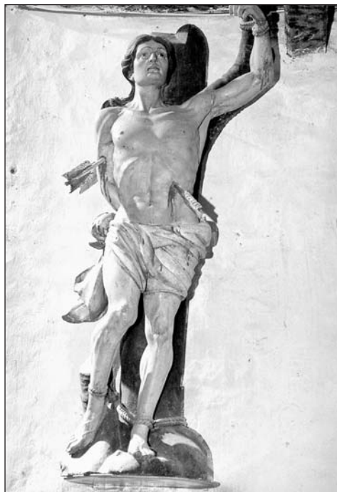
San Sebastián. Parroquial de Javierregay.