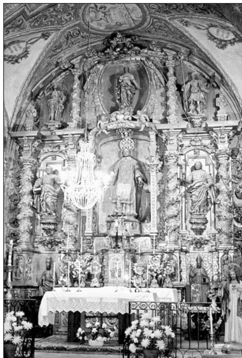
Retablo mayor de san Vicente mártir. Parroquia de Rasal.