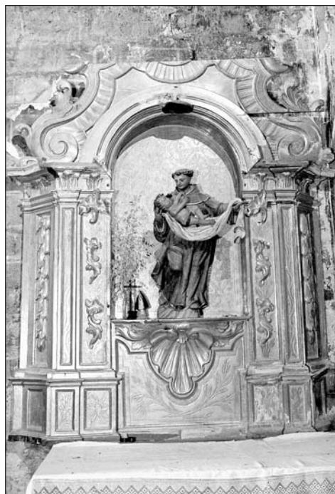
Retablo de san Antonio de Padua. Parroquia de Majones.