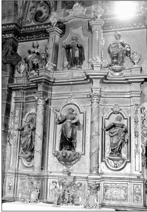
Retablo de san Antonio de Padua. Parroquia de Rasal.

Allí donde el dorado encuentra campos vacíos, se distribuyen labores cinceladas a base de flores, tornapuntas, telas colgantes y formas de escamas. El discurso iconográfico se halla protagonizado por san Antonio de Padua, representado el santo franciscano con un esbelto canon. Las calles laterales acogen a san Joaquín y santa Ana, mientras que el centro del ático se reserva para el bulto de san Antonio Abad, quien aparece escoltado por dos figuras femeninas coronadas. La imaginería que concentra el mueble es de factura artesanal. Algunas prendas de vestir presentan estofados esgrafiados a base de rajados y tornapuntas. Las encarnaciones parecen mates.