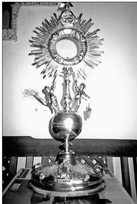
Custodia portátil. Parroquia de Rasal.

esta entrega a 42 libras, 5 sueldos y 4 dineros. En definitiva, el importe total que la primicia entregó a Lacruz, con inclusión de estrenas y agradecimientos, fue de 575 libras. 11