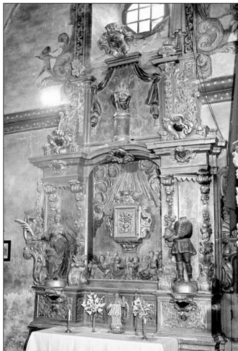
Retablo de los Santos Mártires. Parroquia de Rasal.