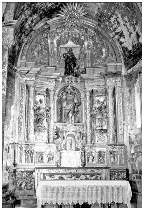
Retablo mayor del Salvador. Parroquia de Majones.

Los mantos de las santas se hallan conformados por finas láminas que aletean al viento, recibiendo las telas un dinámico tratamiento. Las tallas presentan una tipología facial muy semejante. Toda la imaginería del retablo responde a unos caracteres estilísticos propios del arte del maestro Ubalde. Su huella, indudablemente, aparece insuflada en los gestos, actitudes y demás connotaciones plásticas. Para elaborar la figura de san Gil Abad, el artífice debió de tomar como fuente de inspiración el dibujo