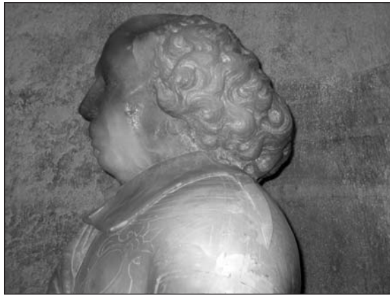
Detalle de la escultura de alabastro de Vincencio Juan de Lastanosa. Cripta-panteón de la capilla de la catedral de Huesca.

La vida de Vincencio Juan Lastanosa es la de un acaudalado erudito que vive una intensa vida, tanto en lo social como en lo familiar. En lo referente a aspectos biográficos que puedan darnos luz sobre sus características físicas o su salud, contamos con pocos elementos de diagnóstico.