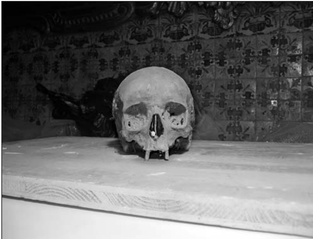
Cráneo de Vincencio Juan de Lastanosa.

El último en morir, y por consiguiente en ser enterrado, fue Vincencio Juan de Lastanosa. Este apareció con el cráneo y la mandíbula sin articulación anatómica, en estado esquelético, en posición, conservando parte de su cabellera en la nuca, tal y como aparecía representado en sus retratos y busto redondo. El torso momificado en una pieza, con una especie de chaleco de fieltro, presentaba una hendidura longitudinal y su jaula torácica se encontraba rellena de paja, elementos vegetales y cal. Las piernas en estado esquelético. Le faltaban los pies, no por motivo de procesos de descomposición, sino achacable a haber sido retirados en aperturas