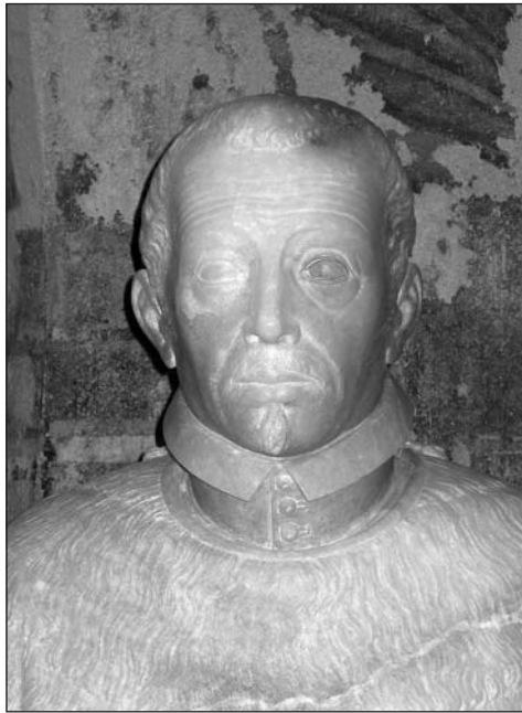
Detalle de la escultura de alabastro del canónigo Juan Orencio Lastanosa. Cripta-panteón de la capilla de la catedral de Huesca.

Tenía 56 años cuando murió, y su hermano lo enterró provisionalmente ante el altar de la cripta panteón, “bajo el ara peana donde ponen los sacerdotes los pies cuando hacen misa”. Así describe este interesante detalle, pero resulta inverosímil, ya que bajo el suelo de la cripta existe un fino pavimento que imposibilita ningún enterramiento.