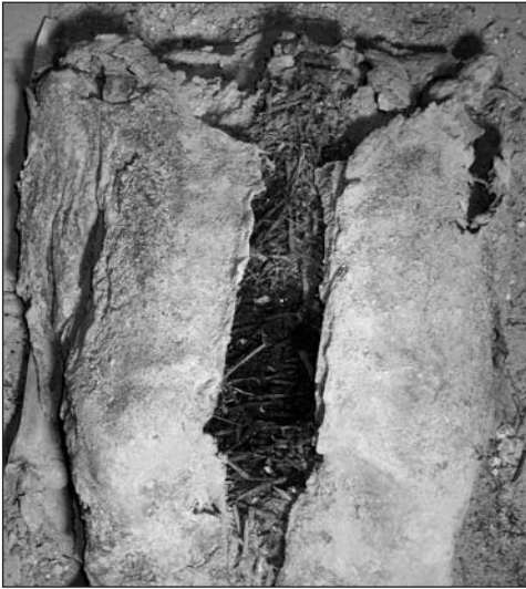
Torso momificado de Vincencio Juan de Lastanosa.