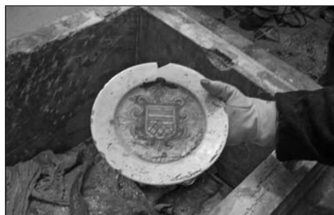
Plato de cerámica vidriada con el escudo de los Lastanosa.