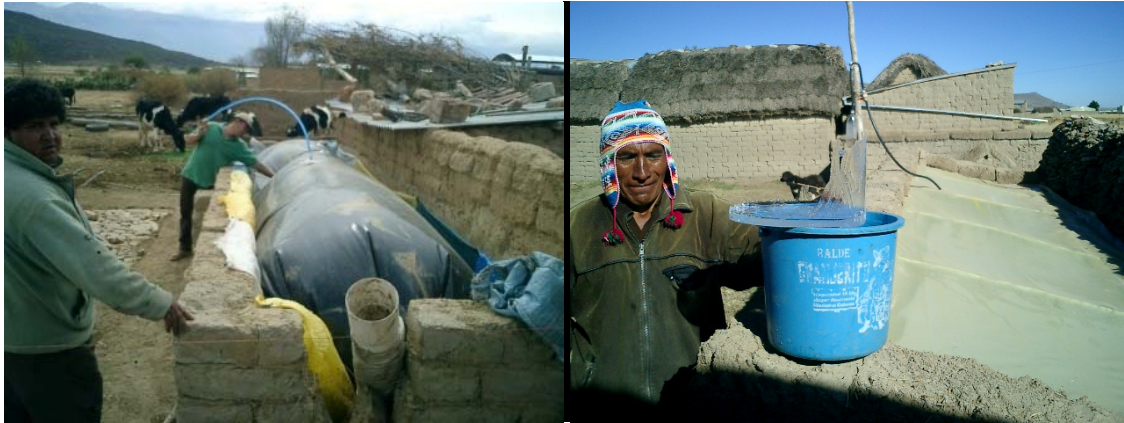
Biodigestor en Valle.

eficiente si se emplea como combustible. El resultado de este proceso genera residuos con un alto grado de concentración de nutrientes y materia orgánica, (ideales como fertilizantes) que pueden ser aplicados frescos, pues el tratamiento anaerobio elimina los malos olores y la proliferación de moscas.