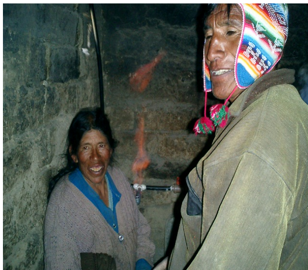
Uso del Biogás por gente de altiplano Boliviano

Los beneficios directos de la tecnología de biodigestión anaerobia son: