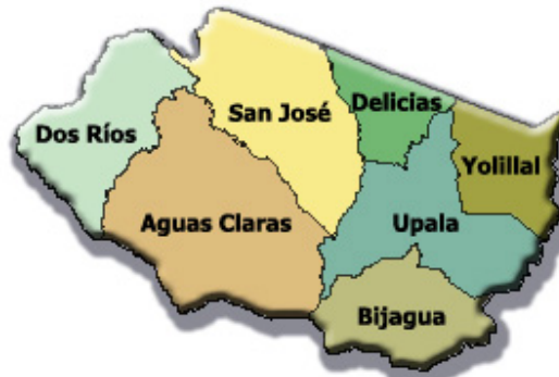
División política de Upala