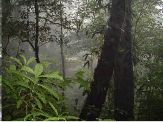
Bosque Heliconia en Costa Rica

Epígrafe: Riqueza de fauna y Flora en la región del Norte Hueter. Costa Rica