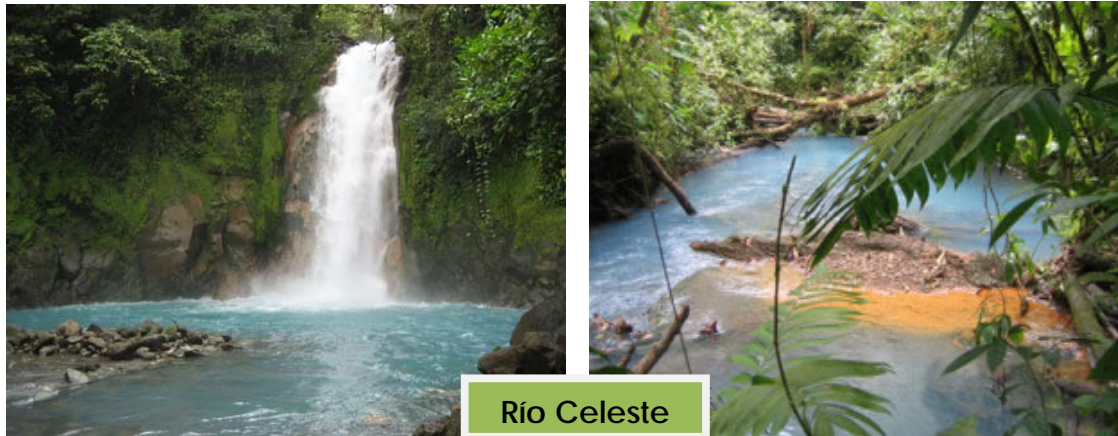
Epígrafe: Patrimonio natural de la región del Norte Hueter. Costa Rica

El albergue Heliconia ofrece servicios integrales: Hospedaje, alimentación, guías locales especializados y transporte; el Albergue recibe, un promedio de 750 visitantes al año en hospedaje y 1500 personas que visitan el lugar. Su gran éxito radica en la ingeniosidad de integrar ese proyecto de hospedaje y otros servicios, con el manejo de la enorme reserva de 76 hectáreas y el Parque Volcán Tenorio.