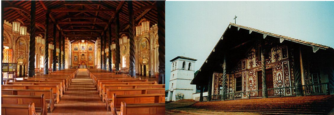
Iglesia de la Concepción de Chiquitos