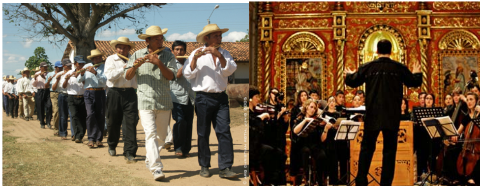
Desfile de la tamborita del cabildo de San Antonio Festival de música renacentista

De acuerdo al informe de Desarrollo Humano del 2004, PNUD, el índice de desarrollo humano de Bolivia es de 0.641 y la del departamento de Santa Cruz de 0.689, el municipio Puerto Quijarro, el más desarrollado de la gran Chiquitania, ocupa la posición 0.710 y el de menor IDH la ocupa el municipio El puente, con la posición 0.549