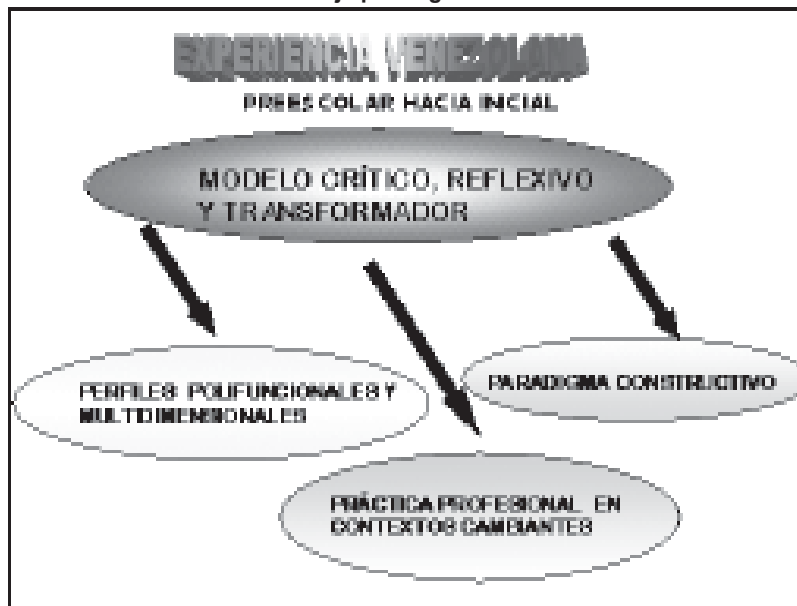
[Gráfico 1] Perfil bajo paradigma constructivo

Para el año 2000 la Comisión de Formación Docente culmina la elaboración del perfil cuando incorporaba en el documento definitivo las sugerencias y recomendaciones de los especialistas que lo validaron, situación propicia para incluir los nuevos basamentos legales de la República Bolivariana de Venezuela (Diciembre, 1999). A partir del año 2000, el documento de aproximación se considera oficial para los nuevos Vice-Ministerios recién creados en el Ministerio de Educación, Cultura y Deportes (2000). Se presenta de manera oficial a las instituciones de Educación Superior y como documento orientador no prescriptivo para las universidades. Además, la Dirección de Educación Preescolar incorpora el perfil en el nuevo normativo del Nivel Preescolar (Octubre, 2001). A partir de este momento, la Dirección General de Educación Superior de quien dependía oficialmente las instituciones de Educación Superior decide, a partir del documento de aproximación, emprender el proceso de sensibilización para el cambio en la formación docente en las distintas Instituciones de Educación Superior que administraban la carrera de Educación Preescolar en ese momento en el país. Ellas eran: AVEPANE- CUC- CULTCA - CUNIBE- CUAM- CUFT- CUMT- IUJO- IUNE-INSULAR- IUTAC- IUTAR- IUTEMBI- IUTOOL- IUTEPAL- IUTEPEC- IUTIRLA- IUT RBB- UNIHER- READIC e IUT delfin Mendoza. (Este ultimo instituto tecnológico decidió cerrar la carrera.)