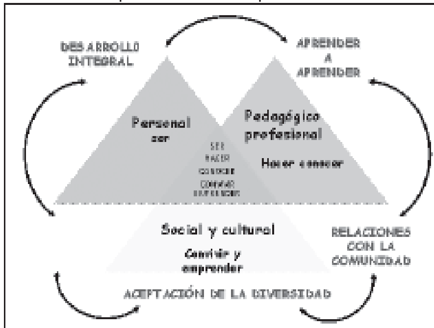
[Gráfico 2] Perfil del profesional de la docencia para la Educación Infantil

Utiliza la comunicación oral, escrita, gestual y corporal para interactuar con los niños, niñas de 0 a 6 años y adultos.