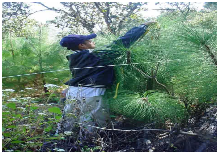
Figura 2. Juan Vázquez, habitante local, muestreando poblaciones de pinos.