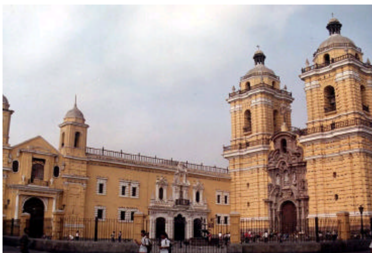
Convento de San Francisco – Lima, Perú

Hace ya unos meses, tras pedir permiso al responsable de la biblioteca del Convento de San Francisco en Lima, fui a visitarla a ella y al convento en sí. Es todo un conjunto de patrimonio histórico artístico, además de uno de los centros de culto con mas devoción no solo de Lima sino de todo el Perú.