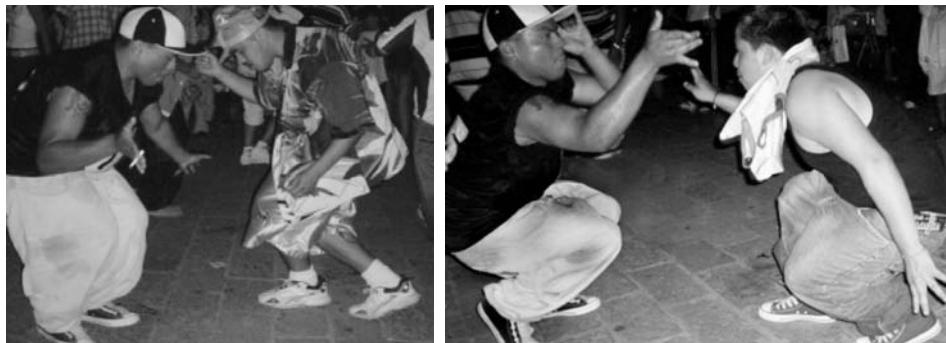
Jóvenes colombianas de Monterrey bailando cumbia.

dentro de la estructura de movimientos y manejos del cuerpo permitidos en la sociedad. Dentro de las culturas, es por intermedio de la tecnificación corporal (Mauss) como las estructuras sociales llegan al interior de los individuos; así las demandas sociales se instalan en los cuerpos en movimiento (Islas, 2001).