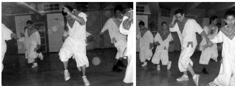
Grupo de baile colombiano “Graffitos Colombia” de Saltillo, Coah., bailando cumbias al muy particular y llamativo estilo de esta ciudad. 18

espacio-tiempo relativamente “regulado” y siguiendo el compás de una música. La diferencia es que en el actual baile de cumbia regio, al estar abiertamente establecido el conflicto entre bandas, la violencia no está regulada, los participantes no controlan el nivel de agresión, ni los golpes están estrictamente enmarcados dentro de la temporalidad de la canción. Así, a muchos de los bailes y conciertos, los jóvenes de las bandas no van tanto a bailar sino a pelear. Sitios como “La Fe Music Hall” 17 o los bailes de barrio se han tomado como un ring de pelea; son espacios para encontrarse a los rivales y “demostrarles” su fuerza para retarlos. En los golpes y en la “valentía” se logra “el reconocimiento” que estos jóvenes buscan más de sus pares. De nuevo la voz de los protagonistas: