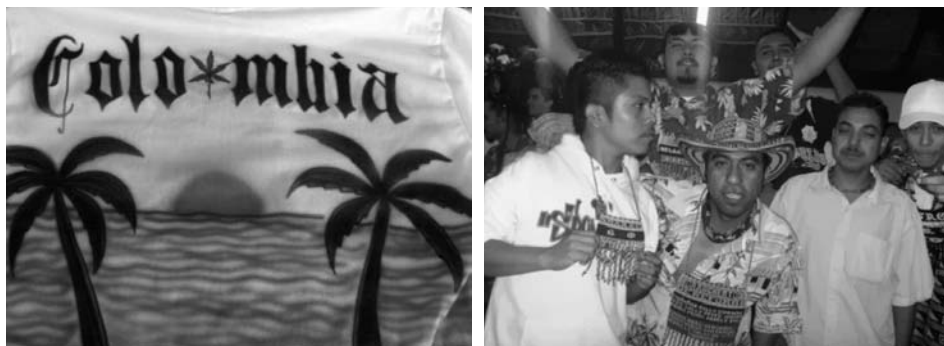
Izquierda: playera comercializada para los jóvenes. Derecha: banda “Los Borrachentos de Reforma”, en el pecho llevan una bandera de Colombia con los nombres de los integrantes. Fotografías: Darío Blanco Arboleda, Monterrey, 2006.

que transgreda dichos parámetros, provoque escándalo e indignación y que sea tratado con desprecio e incredulidad. Ésta es una de las razones por las cuales el vestido es una cuestión de moralidad. Vestir es tan importante que incluso las personas que no están tan preocupadas por su aspecto vestirán de manera adecuada para no sufrir la condena social. De hecho, se habla de la ropa en términos morales: es correcta, está impecable o es vulgar, lujuriosa. Las prendas se convierten en una extensión de nuestro cuerpo, por lo que nos preocupamos constantemente por su estado, por su proyección, ¿cómo se me ve? (Entwistle, 2002: 21-22).