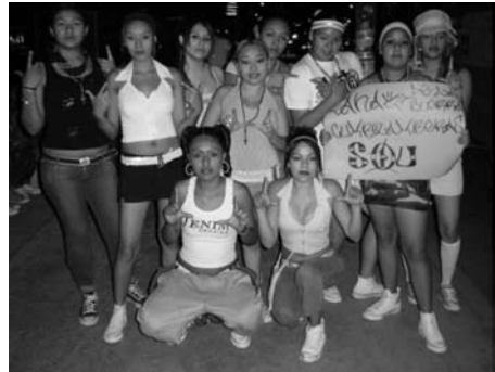
Izquierda: jóvenes colombias en un baile en Guadalupe, Mty. Derecha: banda de las cumbiamberas.

En términos generales, los análisis sociológicos no han tomado en cuenta cómo se viste el cuerpo y los significados inmanentes a este proceso. Ataviarse en la vida cotidiana está relacionado con la experiencia de vivir y actuar sobre el cuerpo (Entwistle, 2002: 17). La ropa está en capacidad de comunicar en referencia a la edad, el sexo, la nacionalidad, la relación con el otro sexo, el estatus socioeconómico, la identidad de grupo, el estatus profesional u oficial, el humor, la personalidad, las actitudes, los intereses, los valores. En ciertas ocasiones, la ropa puede ser la mayor fuente de información sobre una persona (Knapp, 1991: 171).