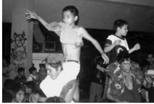
Bailes colombias de cumbia en Monterrey. Derecha: el particular estilo de “La burra”, desarrollado a finales de los ochenta.

1970), lo único que tenían los grupos populares de Monterrey eran discos de acetato, una sonoridad y sus portadas —que les daban mucha información, pero no sobre el baile—. No tenían ningún referente visual de cómo se bailaba esa música. No había videos, los grupos colombianos no habían llegado a la ciudad, no existía la Internet; no tenían manera de rastrear el estilo de baile asociado a la música que les encanta. Así, la primera generación de colombias se encuentra con un sonido que les interpela poderosamente el cuerpo, pero no sabían cómo bailar. Ocurre una vez más lo lógico, cada quien comienza a bailar como lo siente, como se le ocurre, se inventan pasos. Los pasos más creativos se esparcen rápidamente, se difunden exponencialmente en los bailes y fiestas, llegando a ser conocidos en toda la ciudad. En los años noventa, a un presentador de televisión le llama poderosamente la atención la recursividad, imaginación y cadencia de los bailes populares de su ciudad y se dedica a presentarlos en su programa y a “bautizarlos” con nombres llamativos. Así, aparecen los bailes del “gavilán”, “la motoneta”, “el Fome 30”, 14 “la burra”, como los hermanos conocidos de muchos otros que no tuvieron la fortuna de ser “nombrados” por la televisión.