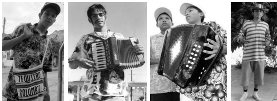
Chavos colombias de Monterrey.

“tropicales” siguen siendo usadas profusamente en la actualidad, ya no se hacen préstamos del rock, sino del hip-hop, con sus pantalones muy anchos (varias tallas más grandes, marca Dickies) y sudaderas igualmente amplias con estampados y aerografiados, en este caso de motivos colombianos . Dejemos que los protagonistas nos relaten: