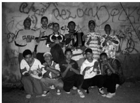
Bandas colombias en Monterrey (2006) Izquierda: “Los Diablitos” de la colonia Arboledas. Derecha: “Los Dickies” de la colonia Nuevo Almaguer.