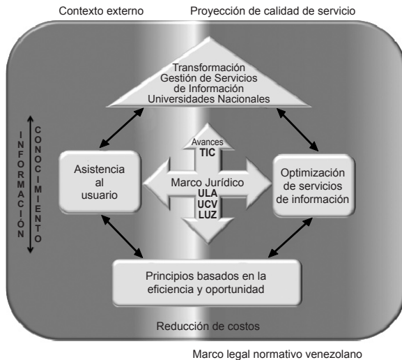
Gráfico 3 Cuadro de interacción de procesos

Estrategias que han de garantizar la asistencia al usuario con principios basados en la oportunidad y eficiencia de gestión institucional; los cuales se requieren para asumir las nuevas tendencias que en gestión de servicios de información se representan en Gráfico 4 .