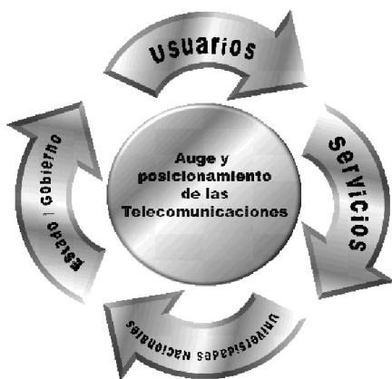
Gráfico 2 Proceso de interrelación: usuario/servicio/universidad/estado-gobierno

Esto ha permitido el auge y desarrollo de las telecomunicaciones, aspectos que paulatinamente han incidido de forma acertada en la interrelación: Usuario/Servicio/Universidad/Estado-Gobierno, según se observa en Gráfico 2 .