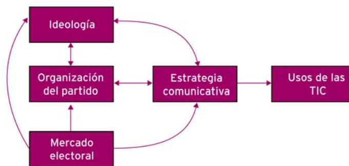
Fig. 1. Mapa conceptual de los factores explicativos de los usos de las TIC por parte de los partidos políticos

En la figura 1 se representa un mapa conceptual, donde las flechas representan las relaciones que suponemos que existen entre los factores explicativos que vamos a considerar y los usos que los partidos hacen de los websites y otras tecnologías de la comunicación. Las relaciones que aparecen aquí forzosamente son muy complejas y no tenemos la pretensión de hacer una explicación detallada en este trabajo. Tan sólo apuntamos una descripción resumida de esta complejidad.