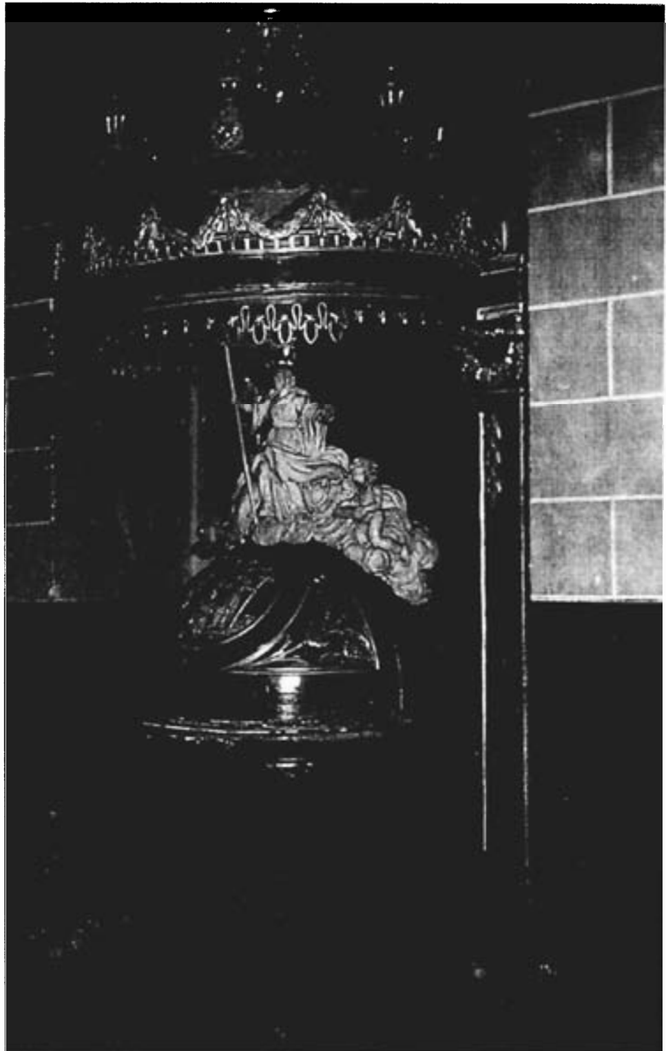
Conjunto escultural de la pila bautismal.