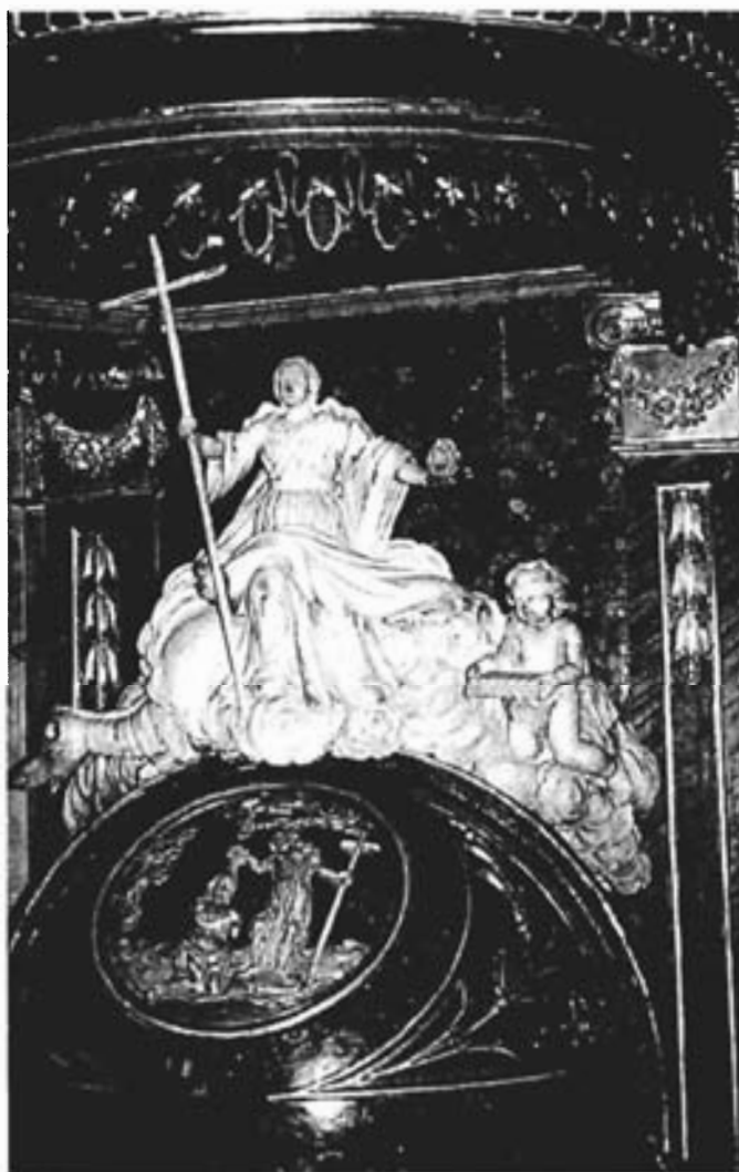
Detalle de la imagen situada sobre la cobertura de la pila.