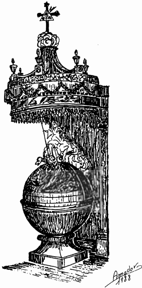
Dibujo artístico de la pila.