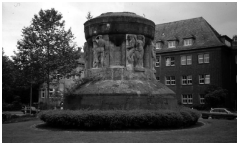
Hans Haacke. Standort-Merry-go round .

Las intervenciones artísticas en el espacio público, desde el punto de vista de su configuración formal y material adquieren las más variadas configuraciones: desde la obra objetual, diferenciada claramente de su entorno, con una función principalmente estética, crítica o formal, que funciona como una escultura o instalación autónoma, independiente. Hasta obras que se integran o sustituyen elementos arquitectónicos o de cualquier otro tipo que forman el paisaje habitual de la ciudad, etc.