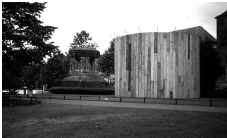
Hans Haacke. Standort-Merry-go round .