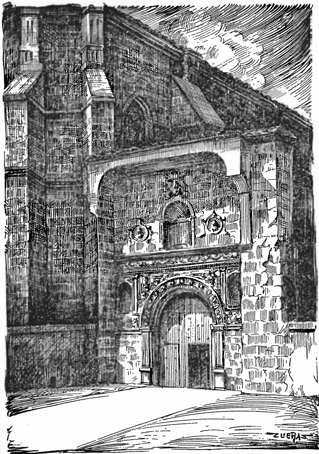
Puerta de la catedral de Barbastro

(Grabado de la obra Huesca, corazón de los Pirineos , de S. Broto)