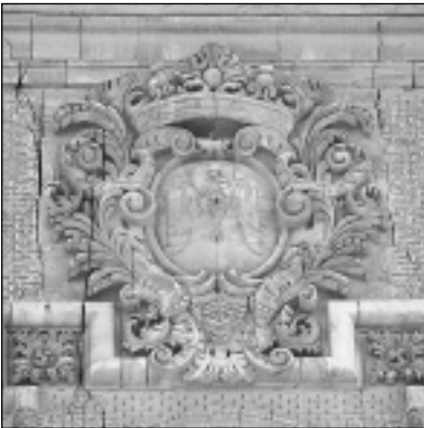
Anagrama de María en la torre suroeste del Pilar, Zaragoza.