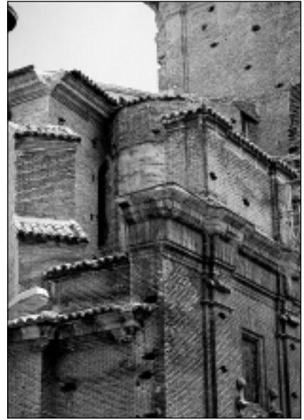
Vista lateral de la fachada, donde se hace visible la antigua torre gótica, en piedra.