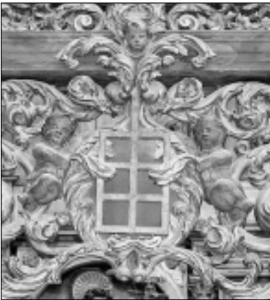
Parrilla laurentina en la reja del antiguo coro de la iglesia de San Lorenzo, que hoy cierra la capilla bautismal.