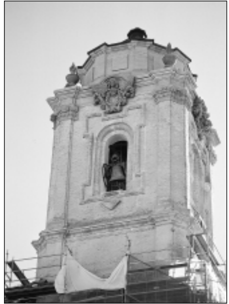
Torre de San Lorenzo después de la restauración. Lado norte.