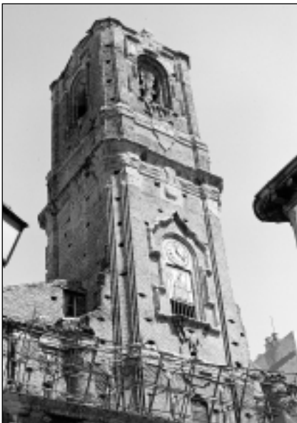
Torre de la iglesia de San Lorenzo.