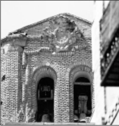
Segundo cuerpo de la torre de San Lorenzo, lado sur.