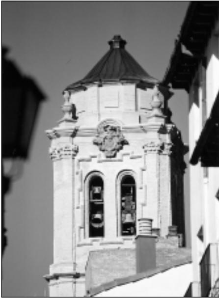
Torre de San Lorenzo después de la restauración. Lado sur.