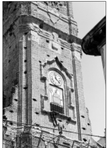
Primer cuerpo de la torre, hacia la plaza.