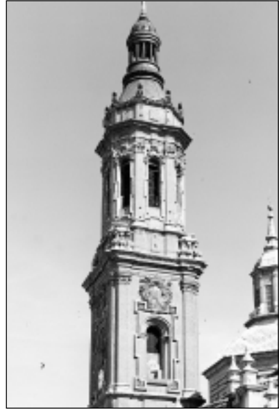
Torre suroeste del Pilar, Zaragoza.