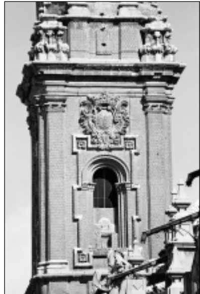
Primer cuerpo de la torre suroeste del Pilar, Zaragoza.