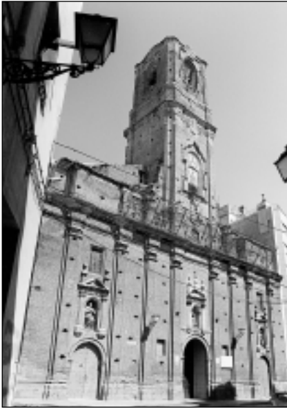
Fachada de la iglesia de San Lorenzo.