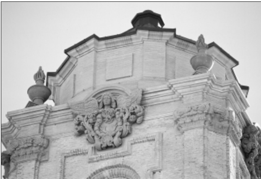
Lado norte de la torre después de la restauración. Detalle de los trabajos escultóricos.