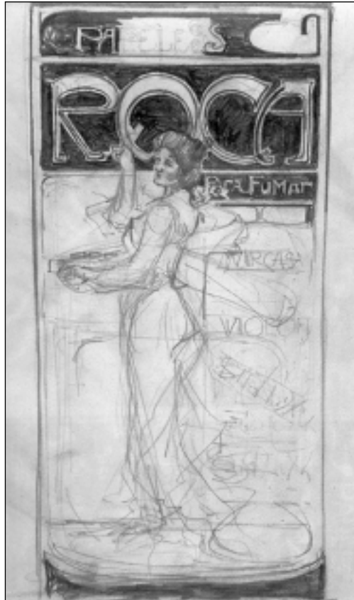
Foto 5. Diseño para la marca de papel para tabaco Roca.