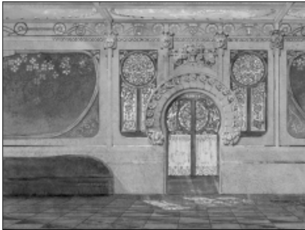
Foto 3. Diseño para un salón modernista.