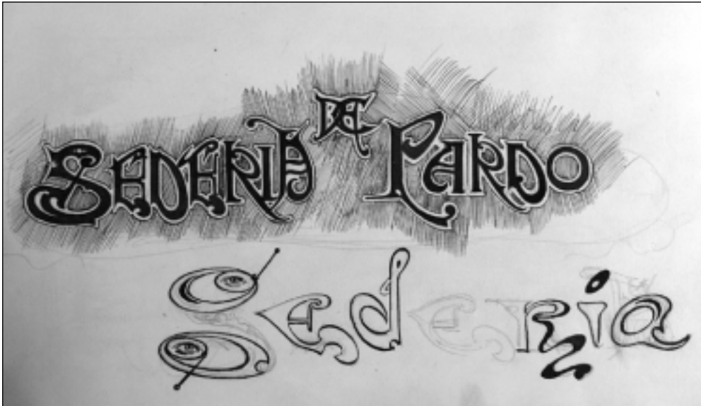
Foto 6. Boceto de letra para Sederias Pardo.