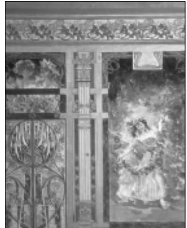
Foto 2. Acuarela clásica envuelta en motivos modernistas.