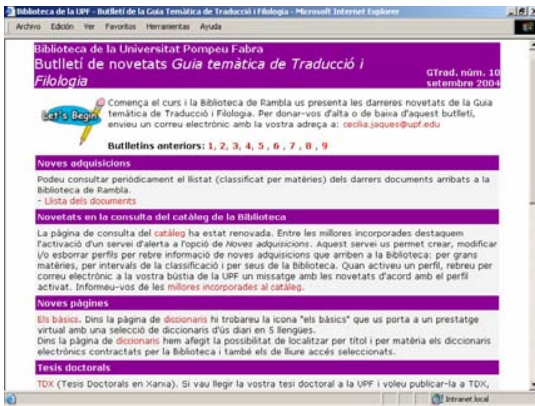
Figura 5: Boletín de novedades de la guía temática de Traducción y Filología

Otro de los sistemas de difusión de las guías temáticas (y en general del sitio web de la Biblioteca) es su utilización en las sesiones de formación: se usan en la explicación de recursos y servicios, facilitando su conocimiento y fomentando su consulta para una mayor autonomía del usuario en la búsqueda de la información.