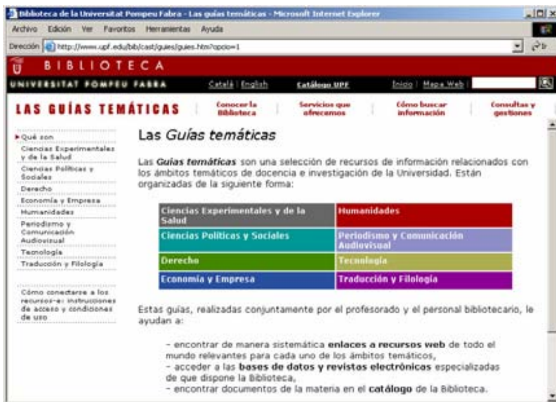
Figura 2: Página principal de las guías temáticas

Como ya se ha dicho, la guías temáticas responden a la organización departamental de la UPF. Hay ocho guías temáticas que se corresponden con los ocho departamentos universitarios.