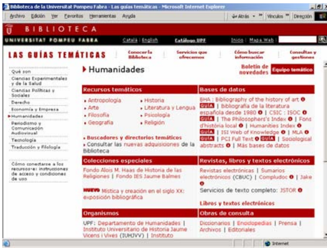
Figura 3: Guía temática de Humanidades