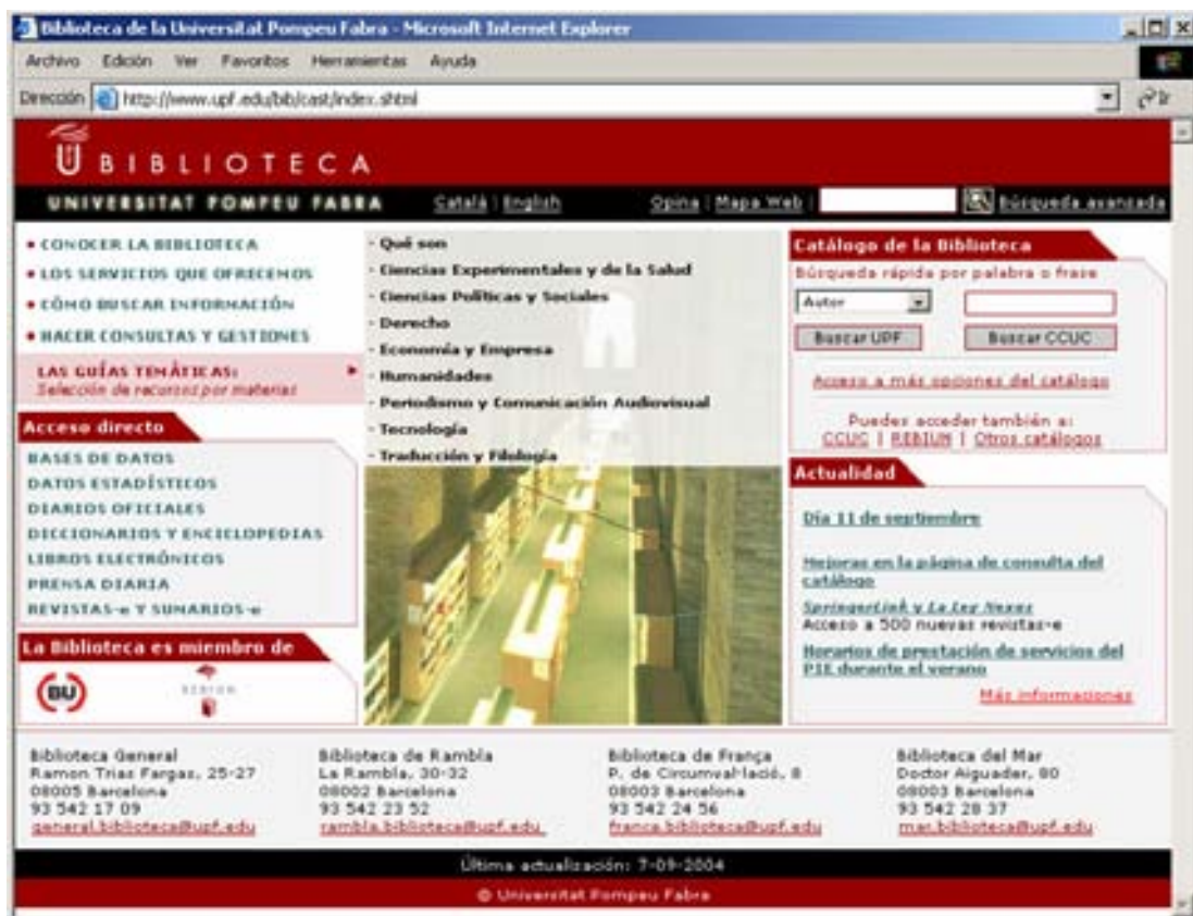
Figura 1: Sitio web de la Biblioteca de la Universitat Pompeu Fabra

Las Guías temáticas son una selección de recursos de información relacionados con los diferentes ámbitos temáticos de docencia e investigación de la Universidad, ordenados de acorde a la estructura departamental de la Universidad, que se publican en el web de la Biblioteca.